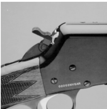
Вставка рис. 7

Откидной курок поворачивается вперед для дополнительных мер безопасности.