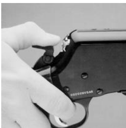
Вставка рис. 5

Если Вы зарядили патрон в патронник непосредственно перед стрельбой, то осторожно переместите курок в полувзведенное положение, а откидной курок переместите вперед. Если Вы не собираетесь стрелять в ближайшее время, разрядите патронник, опустив рычаг вниз . Снимите магазин, убедитесь, что патронник пуст. Поставьте рычаг в прежнее положение, заново вставьте магазин, курок должен быть в полувзведенном положении, откинут назад.