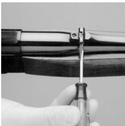
Вставка рис. 9

Вертикальная регулировка: винты, расположенные сверху и сзади целика, отвечают за вертикальную регулировку. Для того, чтобы поднять точку прицеливания, поверните винт по часовой стрелке (см. рис. 10). Для того, чтобы опустить точку прицеливания, поворачивайте винт против часовой стрелки.