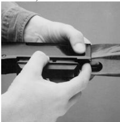
Вставка рис. 8