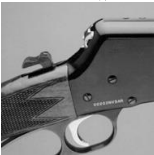
Вставка рис. 7

УБЕРИТЕ ПАЛЕЦ СО СПУСКОВОГО КРЮЧКА ВО ВРЕМЯ ВЗВЕДЕНИЯ КУРКА. ПРИ ПОЛНОСТЬЮ ВЗВЕДЕННОМ КУРКЕ НАЖАТИЕ ЛЮБОЙ СИЛЫ НА СПУСКОВОЙ КРЮЧОК МОЖЕТ СПРОВОЦИРОВАТЬ ПАДЕНИЕ КУРКА И РУЖЬЕ ВЫСТРЕЛИТ. НЕСОБЛЮДЕНИЕ ЭТОГО УСЛОВИЯ МОЖЕТ ПРИВЕСТИ К ТРАВМЕ ИЛИ ЛЕТАЛЬНОМУ ИСХОДУ.